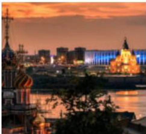
Прибытие в Нижний Новгород